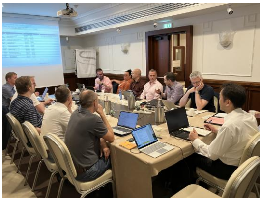
ISO/TC118 国際会議（対面会議）の様子