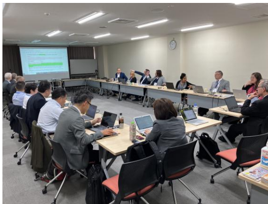
ISO/TC131 国際会議（対面会議）の様子

また、発行されたISO審議案件92件についてすべて回答し、日本の意見の反映に努めた。