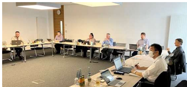
ISO/TC118 国際会議（対面会議）の様子