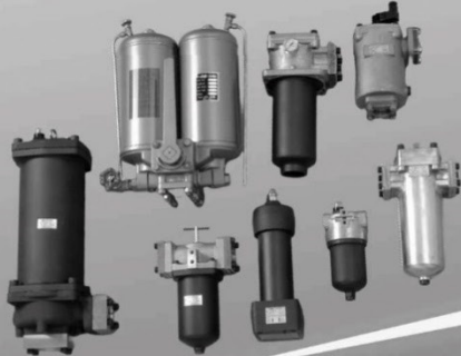
油圧/潤滑油 フィルタ