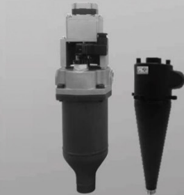
クーラントフィルタ