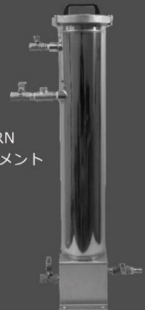
HYDROTURNTM フィルタ・エレメント